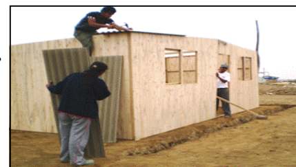
Tipo de casa pre-construida que será ofrecida a familias afectadas en Chincha y Pisco