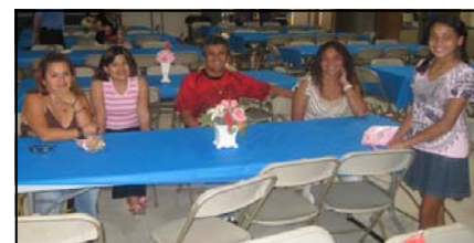
La familia Flores el día del "Spaghetti Dinner"